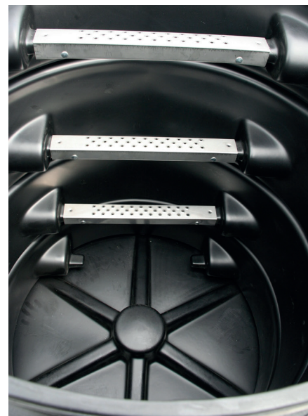
Wnętrze studzienki wyposażone w stopnie ze stali nierdzewnej

Wyposażenie studzienek nie obejmuje armatury do zainstalowania wodomierza (wodomierzy) jak również wejść i wyjść dla rur.