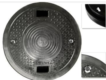
Pokrywa Z-600/DN624-PE przenosząca obciążenia 15 kN z zamkami i uszczelką gumową DN624