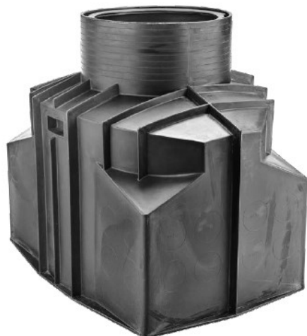
Korpus studni SKO-2/4-PE