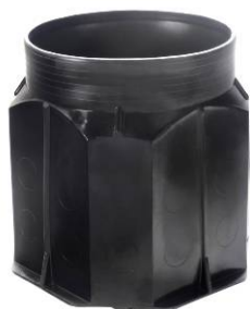
Korpus studni SKO-1-PE

zgodne z aprobatą techniczną IBDiM nr AT/2010-02-2679